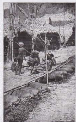
9. LE MASSACRE DES PORCS À JUPIANO, DANS LES MONTAGNES, LE 20 MARS. ON CONSTATE, DANS LEA DÉTAILS, EN MOUVANT, UN « SACRIFIÈRE DES PORCS UN SACRIFIÈRE DES PORCS ». (LONDRES, 1922.)

Un sacrifice rituel de porcs, ou, si l'on veut, un jeu de massacre à signification religieuse, avait lieu à Rome, sur la montagne de Testaccio, durant le moyen âge jusqu'à la fin de la renaissance. Une charte du XIII e siècle mentionne ce jeu du Testaccio comme une coutume observée depuis un temps immémorial (1). Une relation de 1536, assez détaillée, imprimée à Rome (2), nous permet de reconstituer les traits généraux de ce jeu singulier.