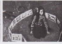
7. GRANDE LAITIERE DE L'ARRÉE DE MAL, NANTOIS. — 8. PETITE FILLE ENVOIÉE D'UNE ÉCRIVAINNE QU'ELLE A CONNUE PAR-PRÈS, D'ARRÉE À UNE FÉRIE DE MAL NANTOIS.