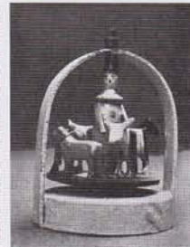
6. SUJET DE L'ÉPIGRAMME.